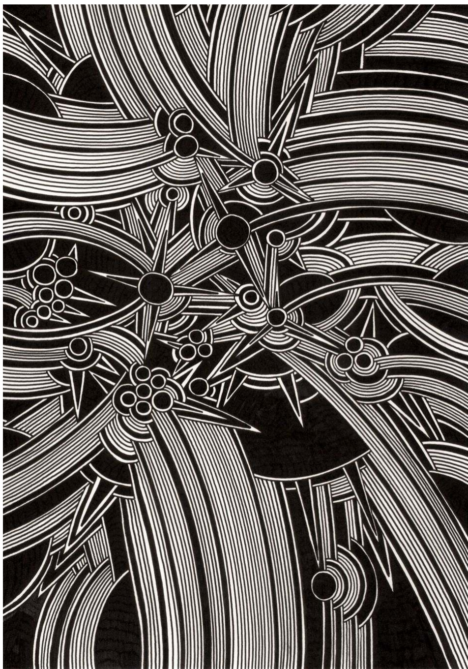
«Naif orders; black version» ( inkwatercolor.com )

El Carro Mayor al norte, con sus siete estrellas altas. Vigila Gēshū de noche, con su cuchillo en el cinto, controlando, hasta ahora, que pastores de caballos no osen traspasar Línáo.